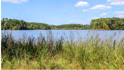
Forest Ridge Park - #37 2100 Old N 98 Hwy, Wake Forest 27587 919-996-5800