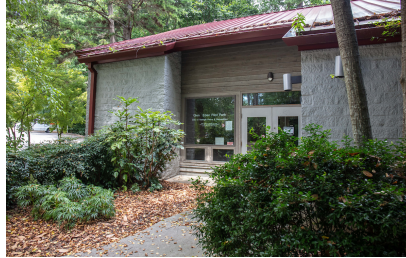
Glen Eden Pilot Park - #35 Glen Eden Drive 27612 919-996-2767