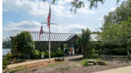
Lake Johnson Waterfront Center - #18 4601 Avert Ferry Road 27606 919-996-3141