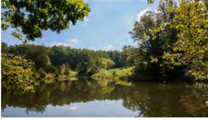
A.L. Wilkerson Nature Preserve - #9 5229 Awls Haven Drive 27614 919-996-6764