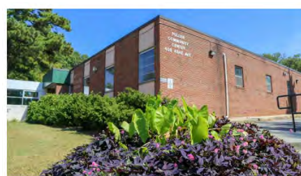
Pullen Community Center - #27 108 Ashe Ave 27607 919-996-6052