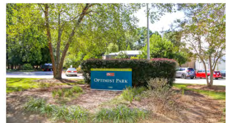
Optimist Community Center - #24 5900 Whittier Drive 27609 919-996-2880