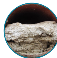
Toallitas Tiradas Por el Inodoro