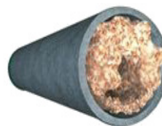
Servicio completamente obstruido