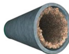
Servicio parcialmente obstruido