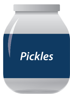
Glass Containers Contenedores de vidrio