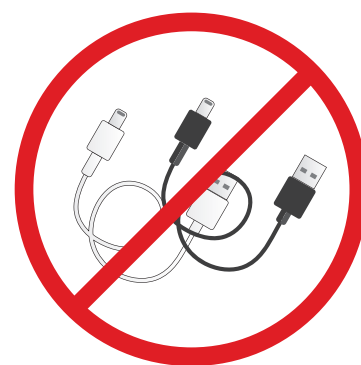
NO TANGLERS NO ARTÍCULOS QUE SE ENREDAN