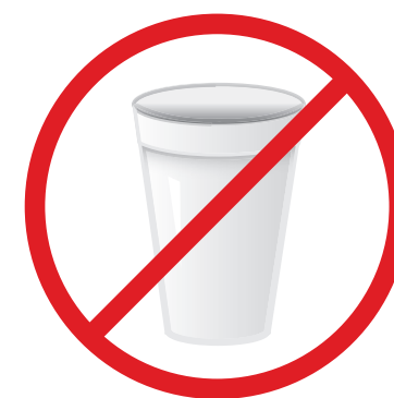
NO STYROFOAM PRODUCTS NO PRODUCTOS DE ESPUMA DE POLIESTIRENO

These items go in the trash: plastic garbage and grocery bags, styrofoam cups and packing material, and tanglers like hoses and strings of lights.