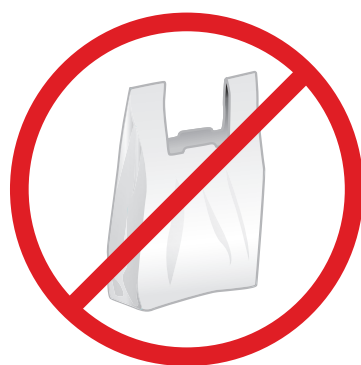
NO PLASTIC BAGS NO BOLSAS DE PLÁSTICO