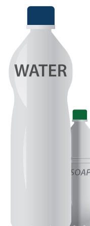
Plastic Containers Contenedores de plástico