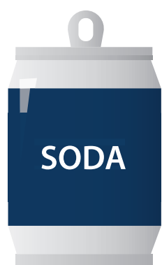
Aluminum Cans | Clean Tin Foil Latas de aluminio | Papel de aluminio limpio

El bote azul es para el reciclado, no para la basura.